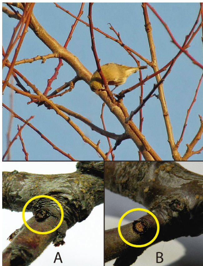
Figura 2. Imagen superior, Jilguero hembra extrayendo las yemas florales de ciruelo europeo; (A) rama de ciruelo europeo con yema floral; (B) rama de ciruelo con yema floral extraída por jilguero.

servados, se calculó que consumen en promedio 12 yemas florales por minuto y el tiempo de permanencia promedio en el árbol fue de 5 minutos.