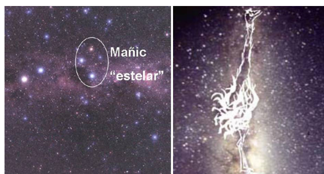
Figura 3. Asterismo mocoví del ñandú estelar (izquierda) y ñandú lacteal (derecha).

Cultura material. Los Abipones hacían alforjas, bolsas y cojines de las plumas de ñandú. “Una parte de éste o sea de las posaderas se la coloca sobre la cabeza en vez de una gorra o de un yelmo. Ellos emplean muchísimo y para diversos usos las plumas” (Dobrizhoffer [1784] 1967: 413).