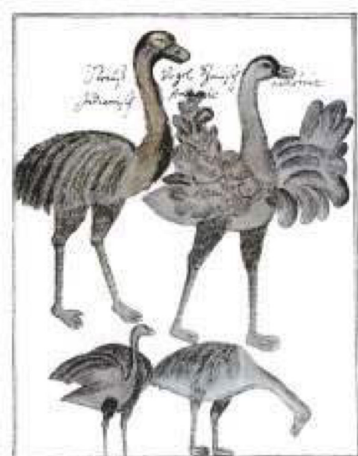
Figura 2. Representaciones del ñandú según el jesuita Florián Paucke (Paucke [s/f] 1944: lámina LXXII).

La caza del ñandú. Los guaycurúes se diferenciaban de otros indígenas chaqueños como lules y vilelas por haber incorporado rápidamente el ganado equino en su vida cotidiana, en especial, para actividades de caza y guerra. Por ello una de las formas de cazar al ñandú fue utilizando caballos para perseguirlo y atraparlo usando las boleadoras o las macanas o mazas: