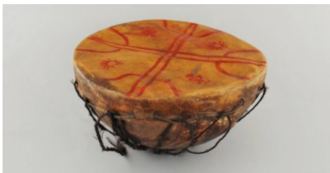
Figura 2. Kultrun el tambor ceremonial mapuche mostrando los dibujos que simbolizan la cosmovisión mapuche. La superficie de cuero está dividida por una cruz que indica los cuatro puntos cardinales, y en cada cuarto hay una estrella, la luna o el sol, representando el cielo. Las líneas en la cruz terminan en patas de gallo que dividen el perímetro del tambor en doce segmentos que simbolizan los meses del calendario. Imagen de uso abierto.

Además de la collonca , la machi emplea el kultrun , su tambor ceremonial (Fig. 2). María Ester Grebe, experta en instrumentos musicales amerindios, indica que