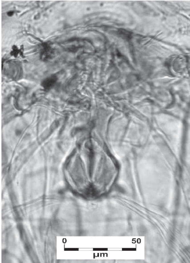
Figura 3.- Sitóforo de Neocolpocephalum turbinatum en Águila, Geranoaetus melanoleucus .

Las presentes observaciones, son los primeros registros en América y los primeros en aves de la familia Furnariidae y Psittacidae. Con la presente nota, se pretende poner en alerta a los ornitólogos sobre un fenómeno que hasta ahora ha sido reportado en escasas ocasiones»