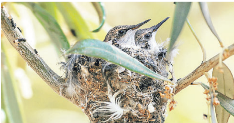
▶▶ Crías del picaflor de Arica.