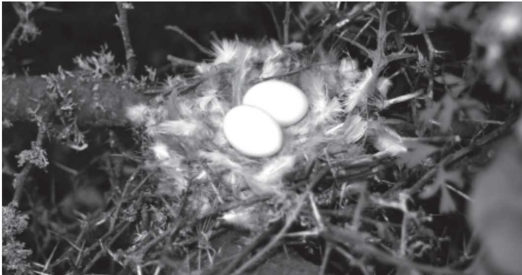
Figura 1. Nido de tortolita cuyana ( Columbina picui ). Notar la gran cantidad de plumas de la misma especie usadas como revestimiento del nido (Ver Texto).